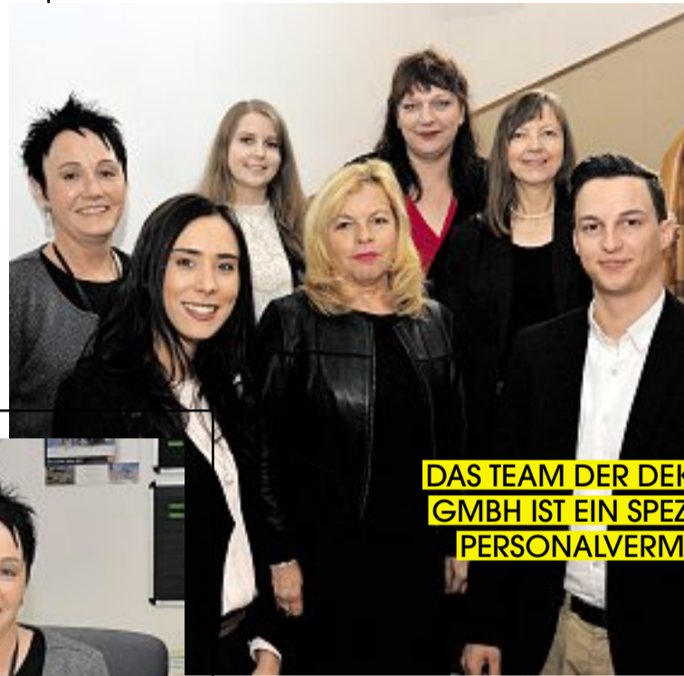
DAS TEAM DER DEKRA ARBEIT GMBH IST EIN SPEZIALIST FÜR PERSONALVERMITTLUNG